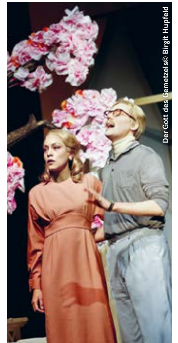
Der Gott des Gemetzels

„So viel versammelte Power auf der Bühne – WTF! (...)“ (nacht kritik)