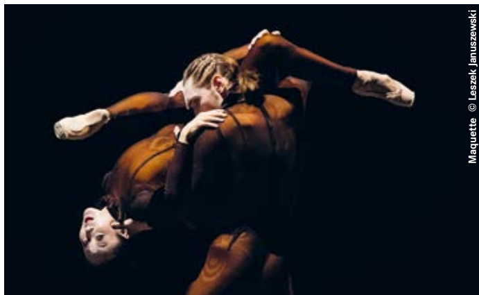
Maquette © Leszek Januszewski

Drei renommierte Choreografen kreieren für die junge Compagnie des Ballett Dortmund einen farnefrohen Ballettabend - bis Juni im Schauspielhaus Dortmund zu erleben!