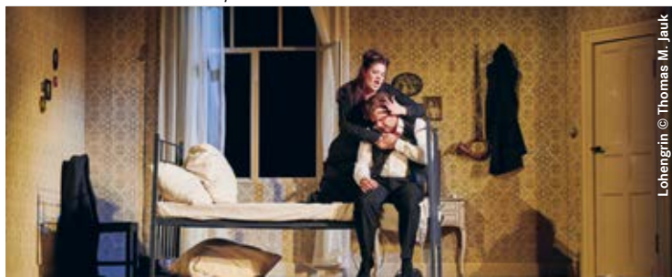
Lohengrin