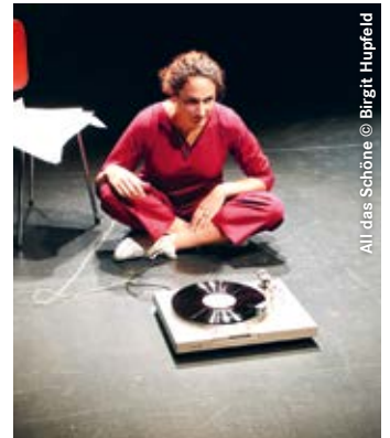
All das Schöne

Als Kind beginnt die Erzählerin eine Liste mit alldem, was an der Welt schön ist. Sie schreibt um das Leben der Mutter, die versucht hat, sich umzubringen. Sie schreibt auch gegen die eigene Ratlosigkeit und findet Worte für das, was unbeschreiblich ist.