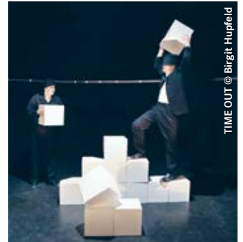
TIME OUT