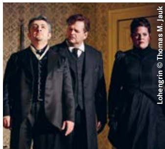
Lohengrin

Romantische Oper in drei Akten von Richard Wagner Libretto vom Komponisten In deutscher Sprache mit Übertiteln