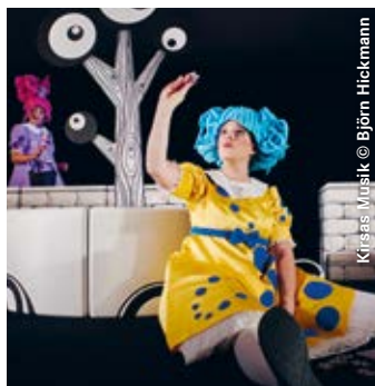
Kirsas Musik

Mobile Oper von Thierry Tidrow und Iliaria Lanzino Auftragswerk der Oper Dortmund In deutscher Sprache Ab 4 Jahren