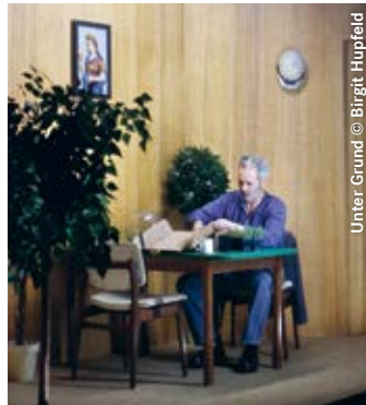
Unter Grund

nen Gedanken und Gefühlen – und springen dann in die Zukunft, in das Jahr 2040, in eine fiktive Welt, in der die Erdoberfläche auf Grund des Klimawandels kaum mehr bewohnbar ist. Die Schächte werden wieder geöffnet und der Bergmann, seine Tochter, eine Aktivistin, ein Bauer und ein Minister treffen sich unter Grund . Werden sie es schaffen, die Erde und damit die Menschheit zu retten? Und welche Rolle wird der Bergmann darin spielen?