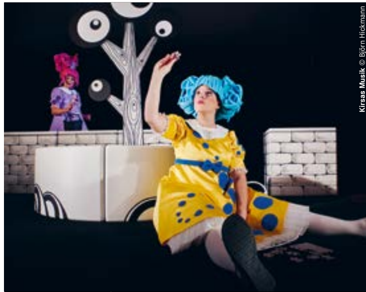
Kirsas Musik