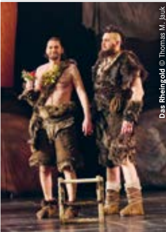
Das Rheingold

Vorabend zum Bühnenfestspiel Der Ring des Nibelungen von Richard Wagner Libretto vom Komponisten In deutscher Sprache mit Übertiteln