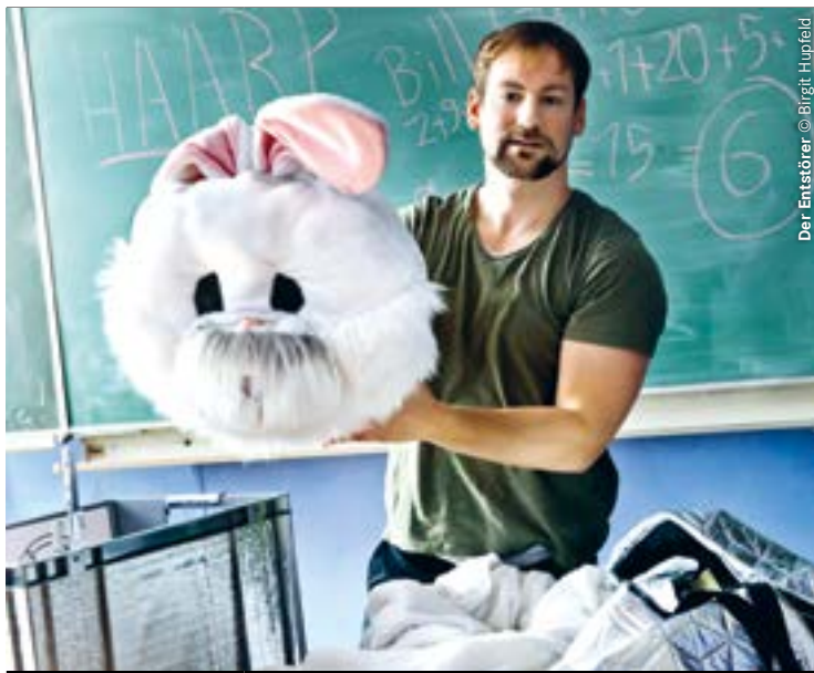
Der Entstörer

Der Entstörer Klassenzimmerstück Ab 9. Klasse mobil