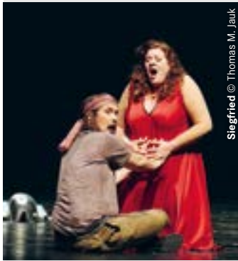
Siegfried

Zweiter Tag des Bühnenfestspiels Der Ring des Nibelungen von Richard Wagner Libretto vom Komponisten In deutscher Sprache mit Übertiteln