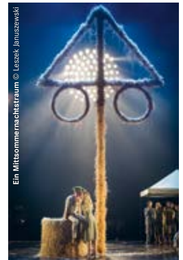
Ein Mittsommernachtstraum

Die Uraufführung 2015 am Königlichen Schwedischen Ballett in Stockholm war ein gefeiertes Medienereignis und auch in Dortmund wurde das Ballett schnell zum Publikumsliebling bei Jung und Alt.