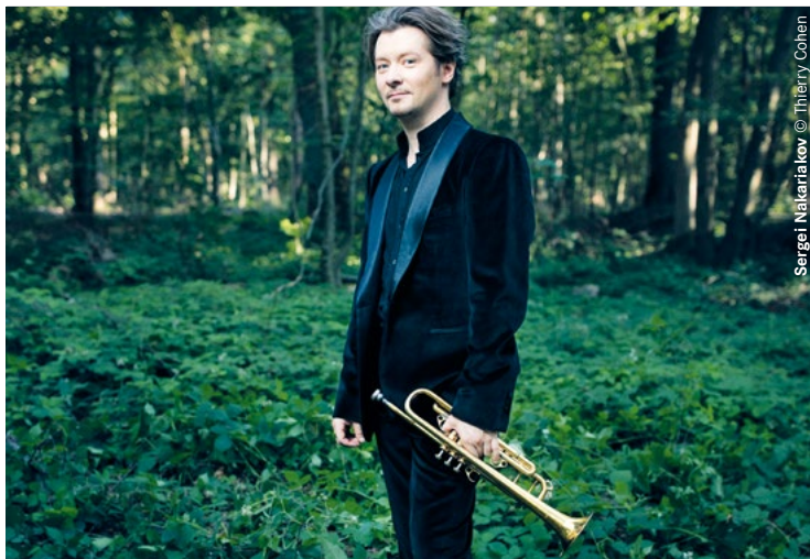
Sergei Nakariakov

7. Philharmonisches Konzert Mendelssohn Bartholdy – Widmann – Beethoven E (Abo: Mittwoch groß/Mittwoch klein 1) Konzerthaus