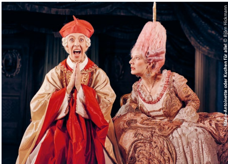
Marie-Antoinette oder Kuchen für alle!