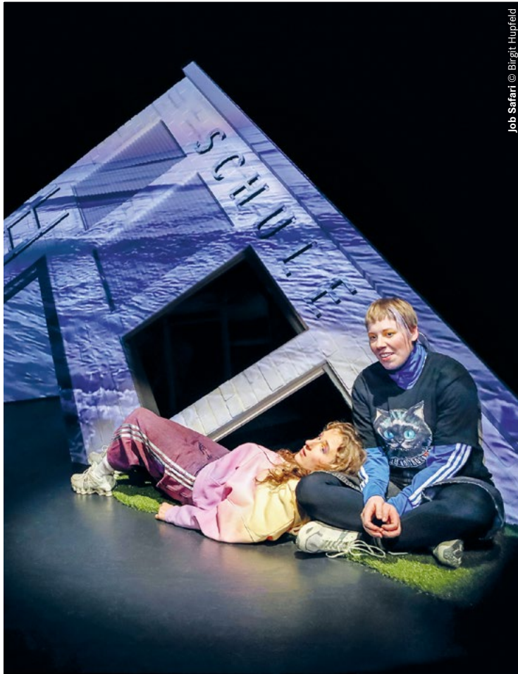
Job Safari