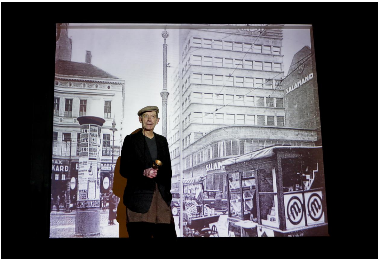
(© Birgit Hupfeld: Andreas Gruhn in der Rolle des Gustav)