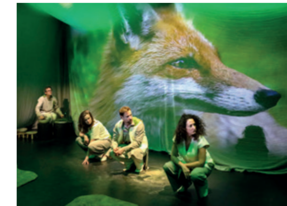
Kinder- und Jugendtheater Wir Tiere

Theaterkarree 1 – 3 44137 Dortmund www.theaterdo.de