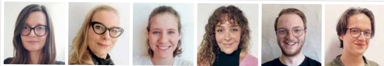
Dany Handschuh Dramaturgie Kristina Senne Musiktheatervermittlung & Projektleitung Lina Fischer Dance Captain Marja Hennicke Gesangscoaching Florian Koch Musikalische Assistenz & Einstudierung Jonas Teepe Regieassistenz